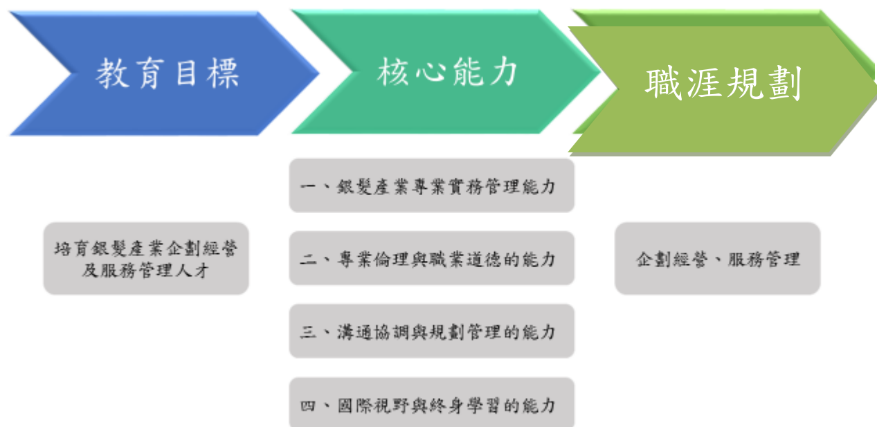
圖 1 碩士班職涯規劃